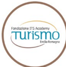
ITS Academy Turismo