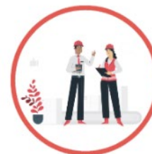
Igiene e Sicurezza