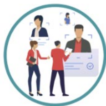
Offerte di Lavoro