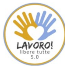
Lavoro libere tutte